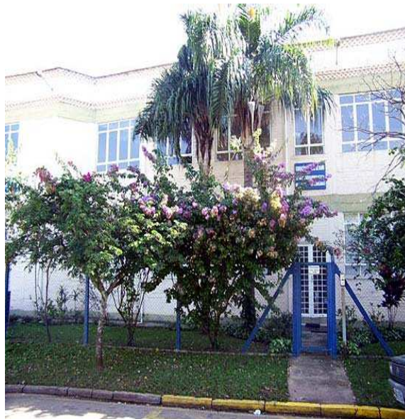
Google Address R. José Antônio Marinho Campinas - São Paulo, 13084-783, Brazil