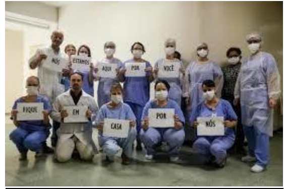
Tabela II - profissionais afastados por Categoria Profissional (números absolutos) Rede básica e Serviços de Referências